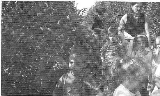
A középső csoport és a dolgozók