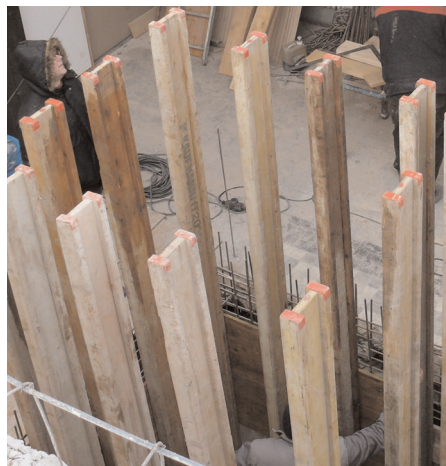
Készül a liftakna

A művelődési ház hátsó szárnyán lévő lapos tető az év minden időszakában beázott, felújítása szinte lehetetlen. Ezért egy magas tetős átépítés látszott célszerűnek. Viszont, ha már magas tetőt építünk, hasznosítsuk is, hiszen a padlástér kihasználása nem sokadlagos szempont. Statikai felmérés is alátámasztotta elképzelésünk megvalósíthatóságát. Ezzel a megoldással mintegy 100 m 2 egybefüggő területhez jut a művelődési ház, amelyben a könyvtárat kívánjuk elhelyezni.