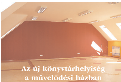
Az új könyvtárhelyiség a művelődési házban