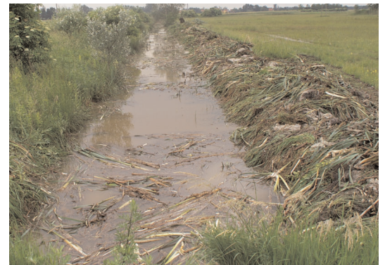
Zákányszéki belsőségi csatorna

dolgozott a markoló, mint pár évvel ezelőtt. Betemetődtek, beszántódtak, eltűntek. Ezeket most ki kell alakítani és meg kell őrizni, ha kell szigorral!