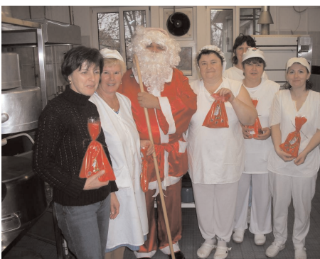
Várunk jövőre is Mikulás!

Mivel a Mikulásnak igen rövid idő áll rendelkezésre, hogy a világ összes jó gyerekét megajándékozza, ezért az idén már december 5-én meglátogatta a zákányszéki óvodásokat és bölcsődéseket. Ezért egyetlen érintett sem reklamált, sőt nagy buzgalommal tisztították a cipőiket, latolgatták, milyen dalaikkal kedveskedjenek a nagyszakállúnak. Kissé félve gondoltak az elkövetett csínyekre, bízva benne, hogy azok észrevétlenül maradtak. Az izgatott várakozás szerencsére gyorsan véget ért, amikor megpillantották a jól ismert piros ruhát, s Miklós püspök utóda kedves szavakkal minden félelmet eloszlatozott. A hetek óta gyakorolt versek, dalok egyre bátrabban szóltak, majd amikor csillogó szemmel nyúltak az édességet tartalmazó csomagokért, a maradék szorongás is átadta helyét a felszabadult örömmel. Még a felnőtteket is elvarázsolta a mese, ami része a gyermeki létnek.