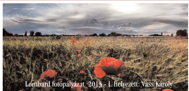
Lombard fotópályázat 2013 - I. helyezett: Vass Károly