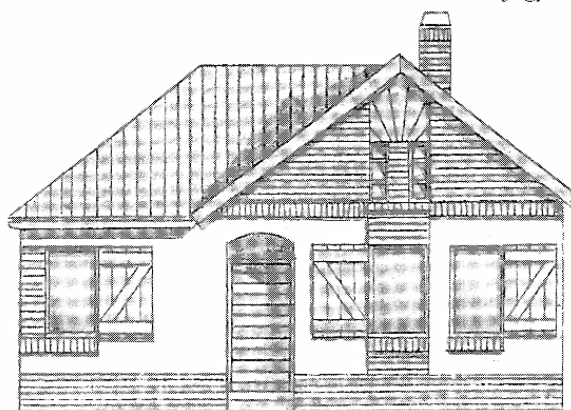
2003 év végére elkészülő bérlakások terve