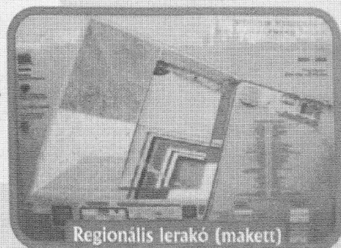
Regionális lerakó (makett)