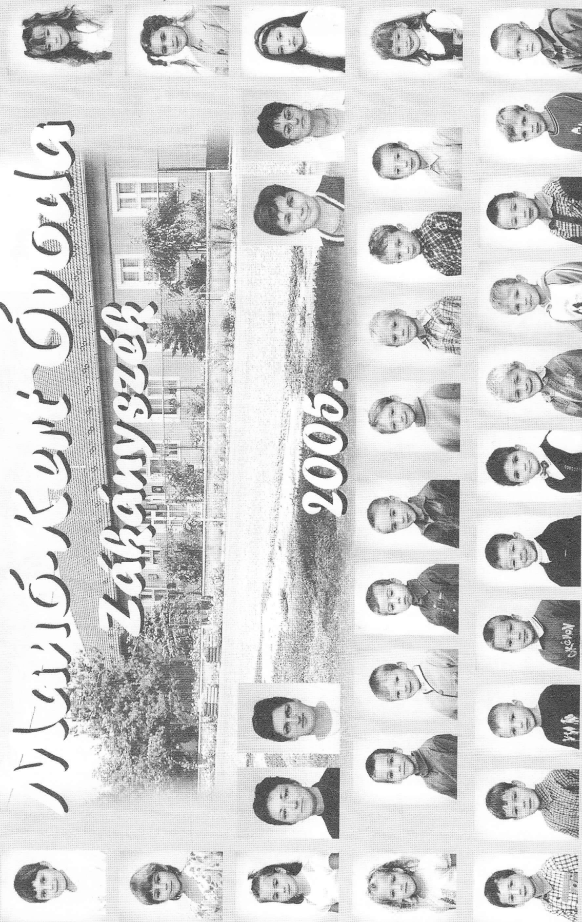
A tablón szereplő névsor a 9. oldalon található.