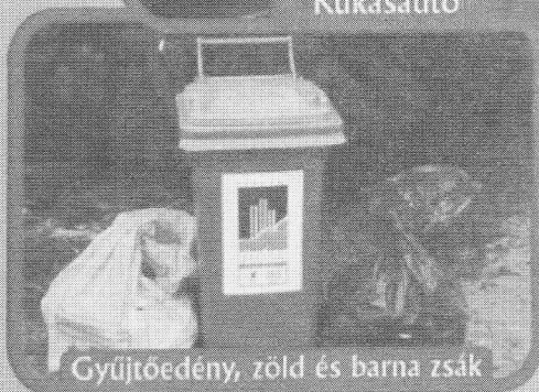
Gyűjtőedény, zöld és barna zsák