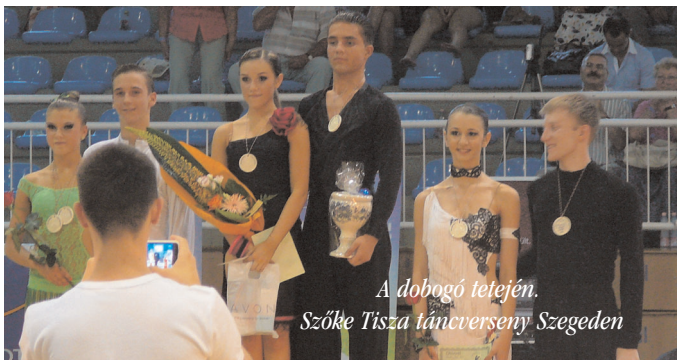
A dobogó tetején. Szőke Tisza táncverseny Szegeden