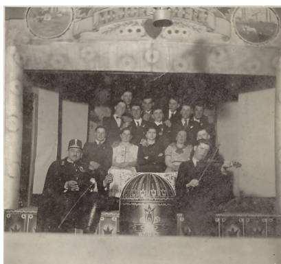
A „Virradat” című színmű szereplőgárdája 1940-ből

kezdetű dal előadásáért, amit Pirooska néni szó lóban énekelt.