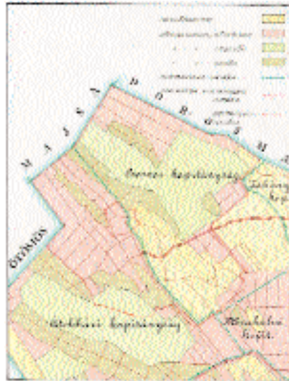
Szeged-Szabadka határper térképe 1748