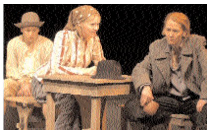
Jelenet az előadásból

Írásom bevezetőjében szoltam Pozsgai Zsolt Pipás Pista átdolgozott történetét elmesélő tanyawestern-jéről. Ez a zenés darab nem történelmi hűségre törekvő dokumentumjáték, hanem fikció, azaz elképzelt, átalakított történet, így is történhetett volna.