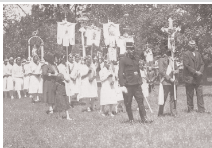
Búcsúi körmenet a templomkertben 1928. június 3-án

Búcsú napján - az ebédet főző gazdasszonyok kivételével - általában a falu apraja-nagyja részt vett a délelőtt második felében tartott nagymisén. A helybeliek magukkal vitték a más faluból érkezett vendégeket is. Korábban előfordult, hogy kereszt és lobogók mögött, szervezett csoportban, általában gyalog mentek az emberek egyik faluból a másikba templombúcsúra.