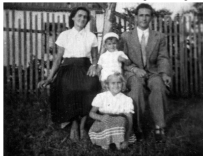
Búcsúba indulás előtt egy családi fotó a tanya előtt (1957)

Tömörkény István 1895-ben írt novellájában a búcsúi vigasság - a hancurozás -, az italozás, a tánc a kápolna közvetlen környezetében, a "csikólegelőül hagyott téren" zajlik. Érdekeséggé válhat, hogy már akkor hűtött italokat szolgáltak fel, pedig hűtőszekrény nem volt. A kocsmáros télen a havat berakta a jégverembe, egy réteg óra egy réteg szalmát, és így a hó megmaradt a meleg nyári napokig. A búcsú napján havas nyakú üveget tettek az asztalra, amelyekből fogyasztva vidáman énekeltek, daloltak és táncoltak, naplementig.