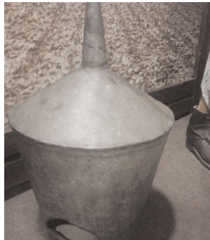
Bádóg locsoló, luklocsoló vagy locsolótök

Ültetésre akkor került sor, amikor a palántának akkora a szára, mint a cigaretta. Fölszedéskor mindig a sűrűjéből szedték a palántát. Az ültetés több napig történt. Kint a földben a bögő tréfas néven is emlegetett útálló gereblyével sorokat húztak keresztbe, hosszába. A találkozásnál van a palántalyuk helye. Volt, aki csak hosszában útalt, és a sorban megfelelő távolságban kapafokkal megjelölte a palánta helyét. Ezután fúróval lefúrták, a palántát betették a lyukba, majd mellé szorították a földet. Lehetőleg eső után ültettek, de homokos talajokon, vagy ha kevés volt a csapadék, be kellett öntözni ezeket a kapa ütötte lyukakat.