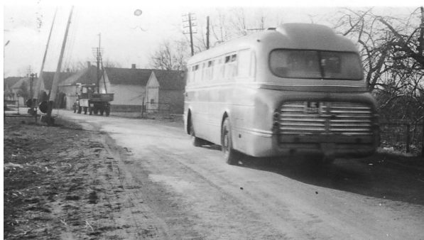
Autóbusz érkezik a faluba