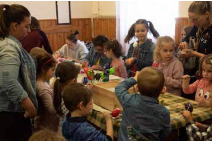
Húsvétváró Kézműves Délelőtt: a hagyományok jegyében tojásfestés, nyuszi figurák készítése, festés és színezés várta a gyerkőcöket. Igazi vidám hangulatot varázsolt a rendezvényre a Szegedi Szentgyörgyi Albert Agóra Mókás Bocskó Bábcsoportjának műsora, de kóstoltunk húsvéti kalácsot, simogathattunk nyuszikat és a napsütésben tojáskeresés zárta a programok sorát a művelődési ház udvarában.