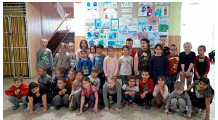
Iskolába csalogató programot szerveztek a nagycsoportosoknak az első osztályosok. Részletek a Suli Rovatban olvashatók.