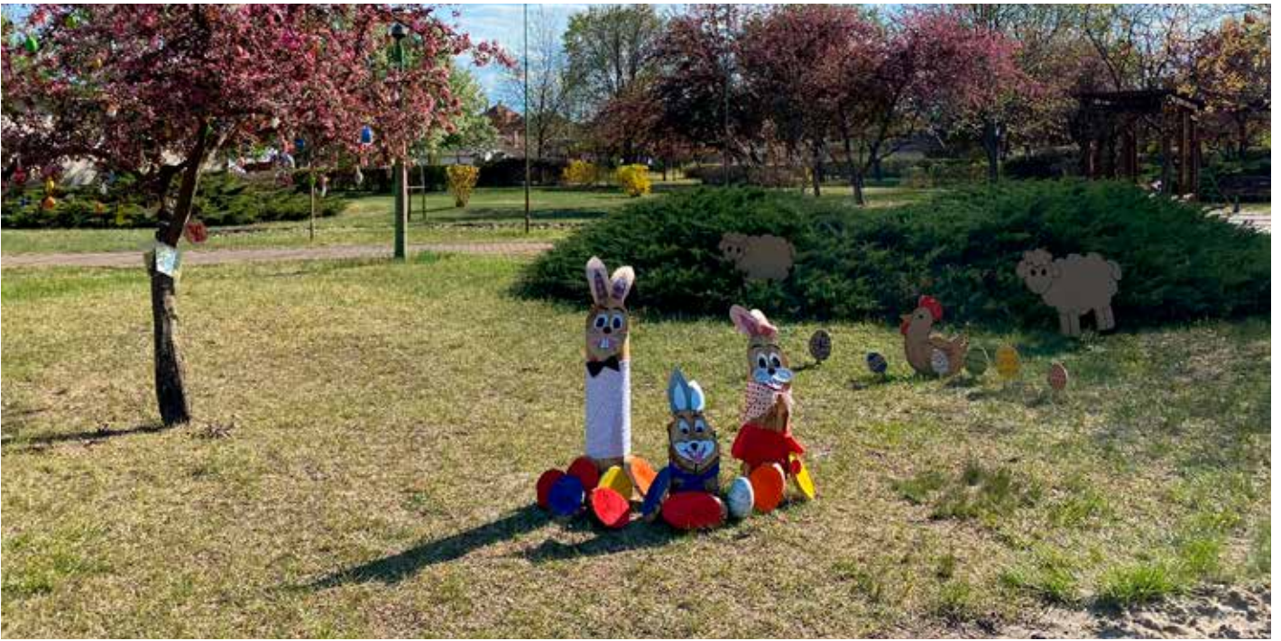
Húsvéthoz közeledve idén ismét közösen díszíthette a falu lakossága a Lengyel téren található tojásfát, a művelődési ház munkatársai pedig kedves dekorációkról is gondoskodtak.