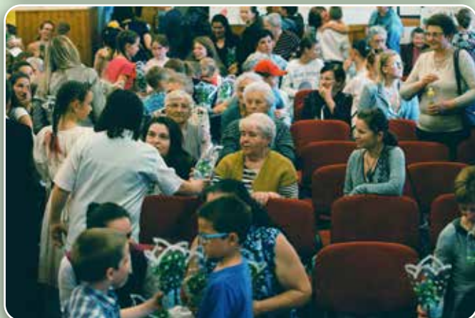
Az Édesanyákat köszöntöttük a művelődési házban május másodikán. Verssel, tánccal, énekel, szép gondolatokkal és végül egy-egy cserép virággal.